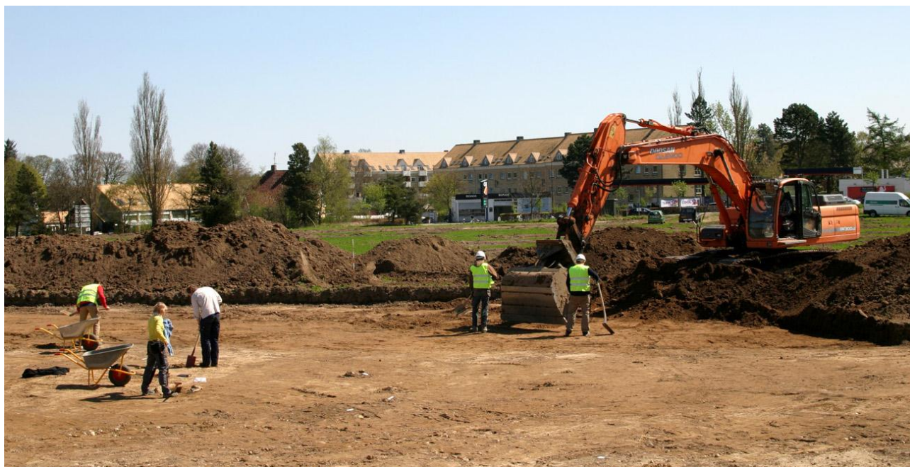
Der er dukket så mange interessante spor fra oldtiden op, at arkæologerne laver en egentlig udgravning ved Langhaven.